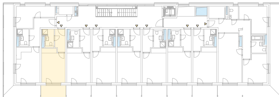
Schéma půdorysu představuje dispoziční uspořádání jednotky. Zobrazené vybavení nábytkem, vestavěné skříně, kuchyňská linka vč. spotřebičů a pračky nejsou součástí dodávky jednotky. Toto zobrazení je pouze pro názornost. Specifikace pro konstrukce, povrchové úpravy a vybavení je předmětem přílohy "Kvalitativní standard".